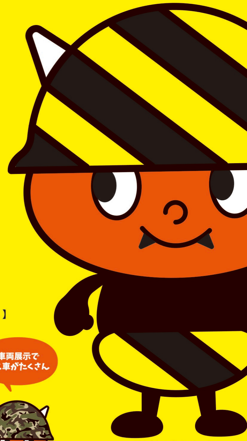
岡山青年会議所のオリジナル イメージキャラクター うらぼう